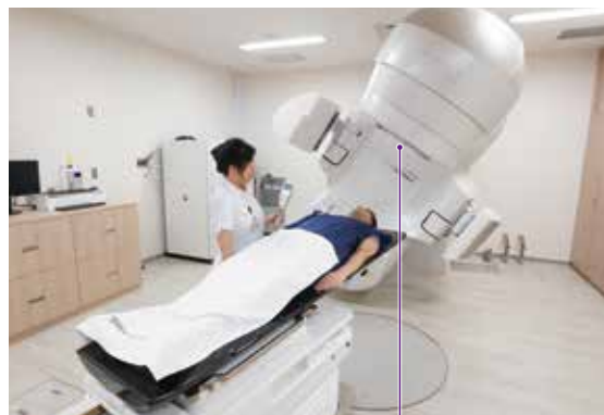
ここから病巣の形に合わせた放射線が出ます